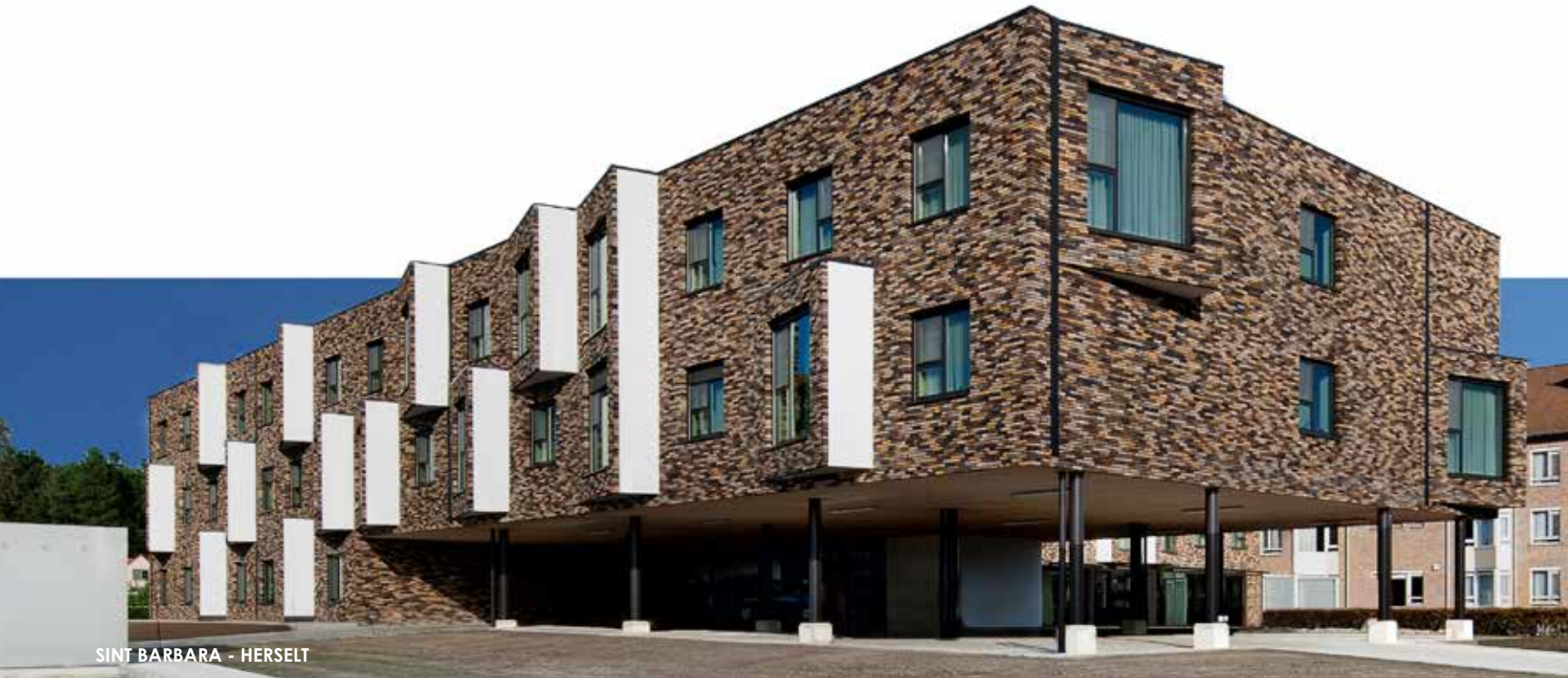
SINT BARBARA - HERSELT

LLOX architecten, een architectenbureau gevestigd in Antwerpen en gespecialiseerd in de gezondheidszorg, draagt vanaf nu zijn steen bij aan de nationale groep ASSAR ARCHITECTS.