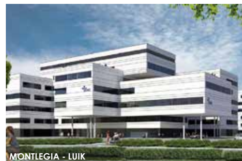
MONTLEGIA - LUIK