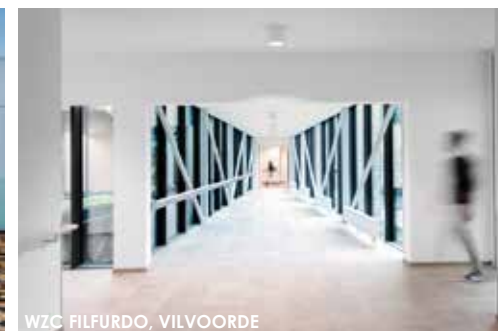
WZC FILFURDO, VILVOORDE