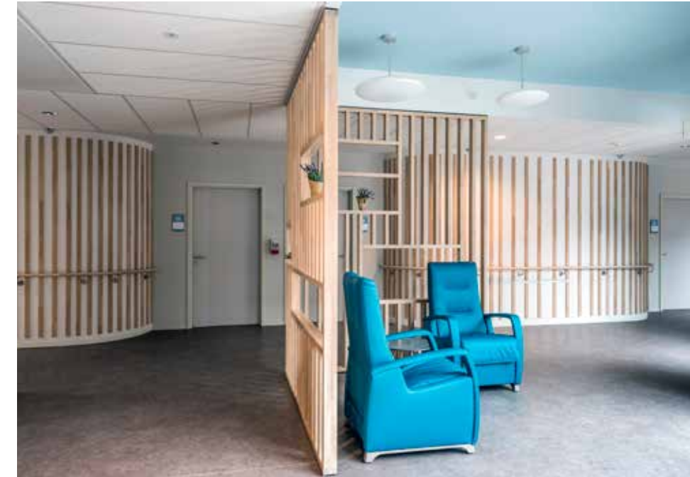
Op verschillende plaatsen op elke verdieping integreerde de architect leef- en eetruimten en zithoeken, schijnbaar afgesloten met een houten afrastering.