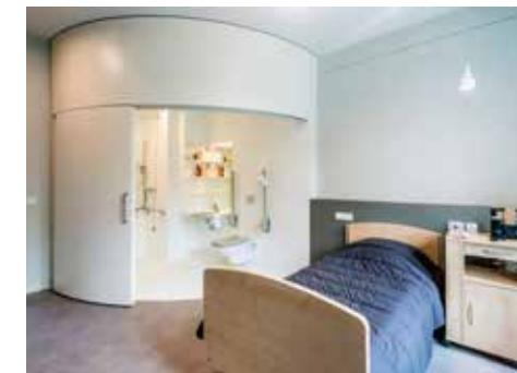
De unieke cirkelvormige sanitaire cel is afsluitbaar met een ronde, verschuifbare wand.